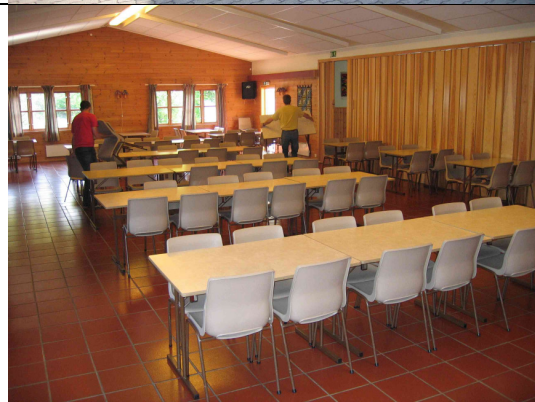
Plassering av bordene