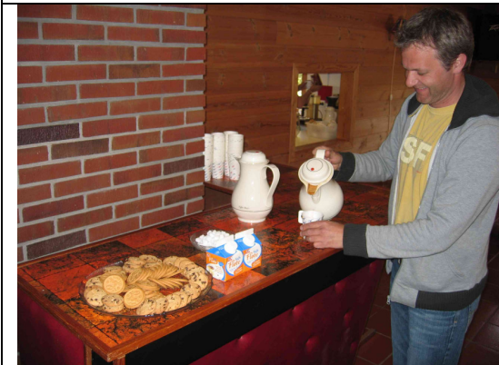
Kaffe og kaker